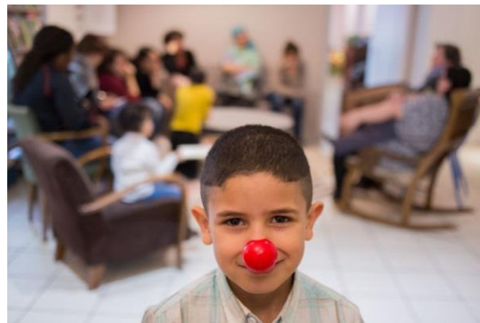
Maison des familles de Mulhouse

pendant 1 an par une Maison des Familles